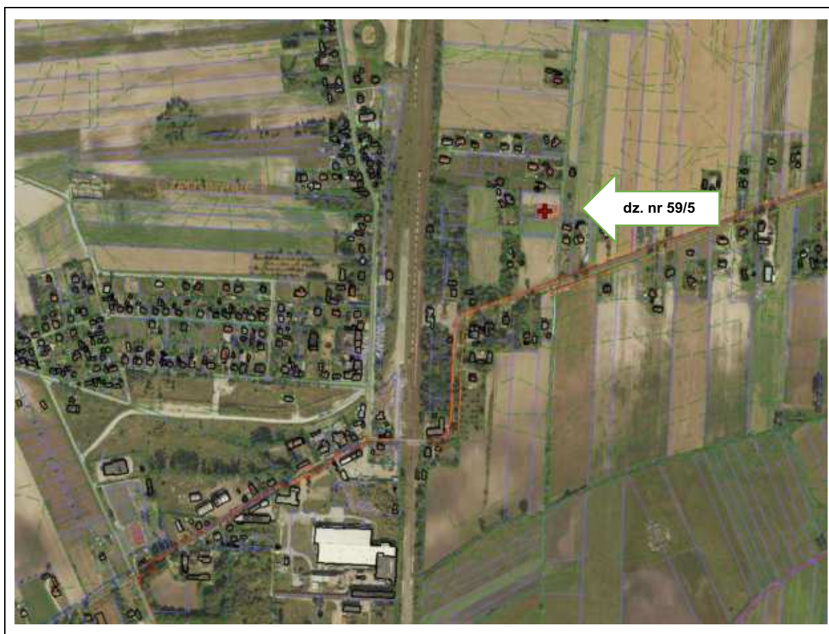
Położenie i otoczenia działki nr 59/5 .

Parcela zlokalizowana jest przy ul. Kolejowej, zapewniając bezpośredni dostęp do drogi gminnej. Bezpośrednie otoczenie działki stanowi rozproszona zabudowa mieszkaniowa jednorodzinna oraz zagrody rolnicze, typowe dla wsi o charakterze wiejskim. W sąsiedztwie występują grunty rolne. Charakter otoczenia jest spokojny, wiejski i mało zurbanizowany, co sprzyja funkcjom mieszkaniowym oraz rolniczym. W odległości ok. 200 m w linii prostej od działki znajdują się tory kolejowe wraz z przejazdem kolejowym, będące częścią lokalnej trasy kolejowej.