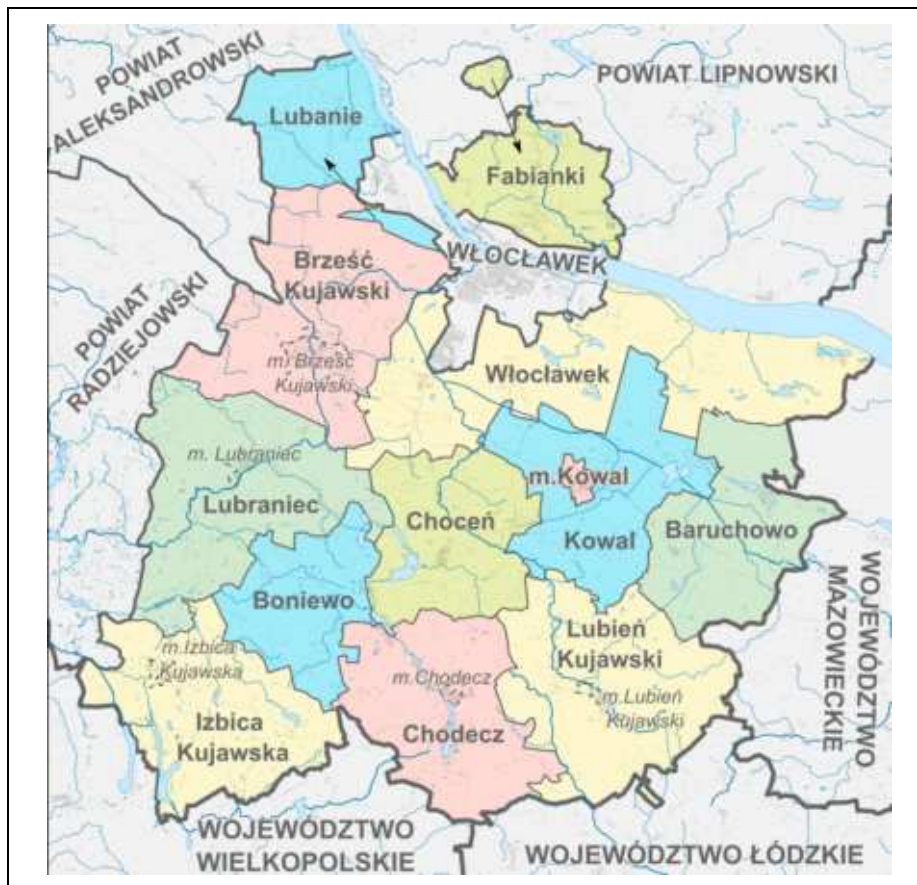
Mapa podziału administracyjnego powiatu wrocławskiego w województwie kujawsko-pomorskim.

obecnością obszarów leśnych, parków krajobrazowych i terenów sprzyjających rekreacji. Ogólnie cechuje się umiarkowanym tempem rozwoju oraz stabilną strukturą osadniczą, co znajduje odzwierciedlenie w lokalnym rynku nieruchomości, gdzie dominują grunty rolne oraz tereny przeznaczone pod zabudowę mieszkaniową o niskiej intensywności.