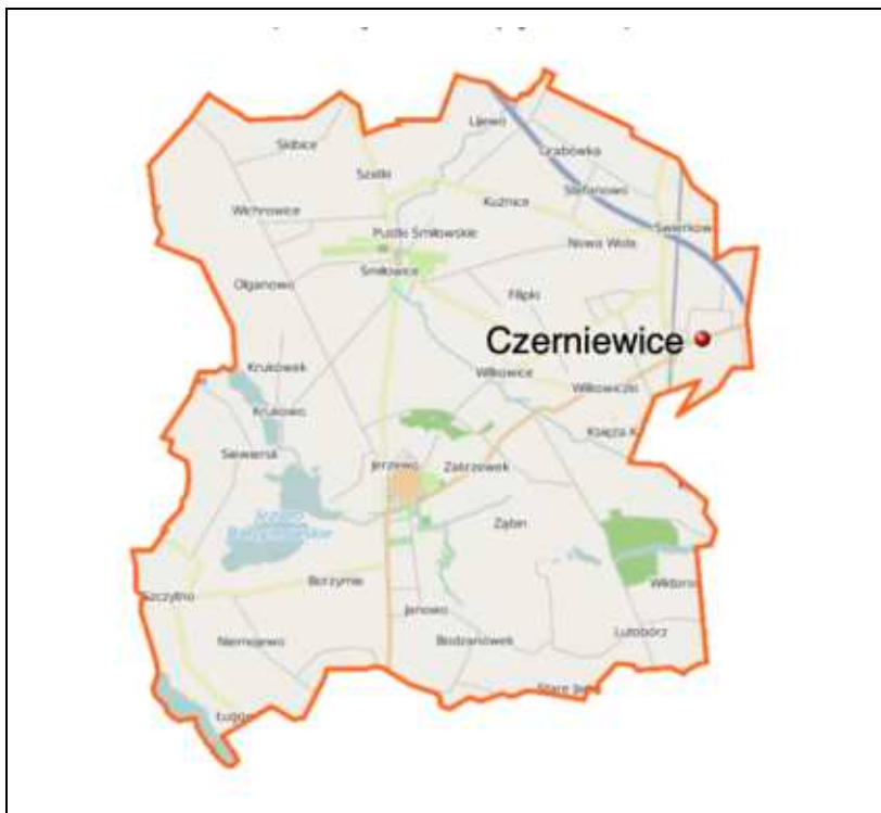
Położenie miejscowości Czerniewice na tle gminy Choceń

Gmina cechuje się spokojnym, mało zurbanizowanym środowiskiem, korzystnymi warunkami przyrodniczymi oraz stabilną strukturą osadniczą. Czynniki te wpływają na lokalny rynek nieruchomości, na którym przeważają grunty rolne oraz działki przeznaczone pod zabudowę mieszkaniową jednorodzinną o niskiej intensywności, ze stopniowym wzrostem zainteresowania terenami położonymi w pobliżu głównych dróg oraz miejscowości gminnych.