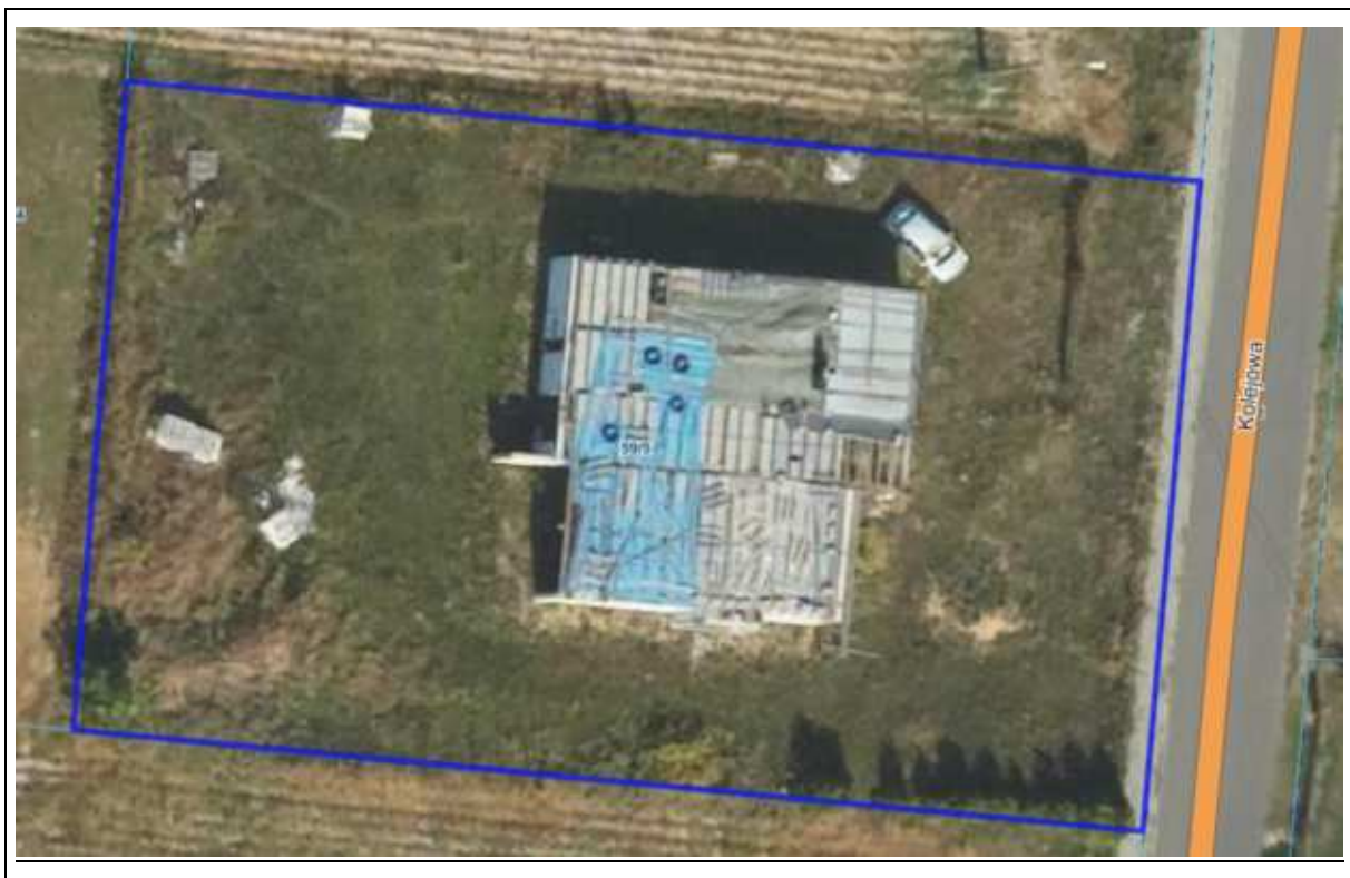
Działka nr 59/5.

Na działce posadowiony jest budynek mieszkalny jednorodzinny z wbudowanym garażem, niepodpiwniczony, z poddaszem nieużytkowym, w wczesnym etapie realizacji, w stanie surowym nieukończonym, o stopniu zaawansowania robót mniejszym niż stan surowy otwarty. Bryła budynku regularna. Budowa obiektu rozpoczęła się w 2019 r., skończyła w 2023 r. Obiekt jest nie oddany do użytkowania, nie posiada stolarki okiennej i drzwiowej ani wykończenia elewacji.